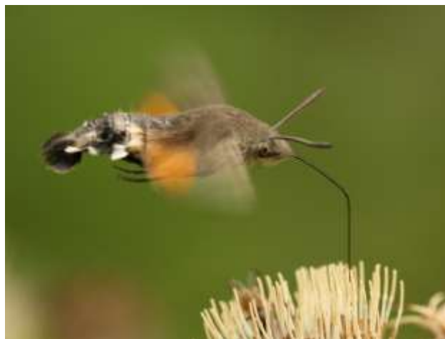
Dlouhozobka chrastavcová (Hemaris tityus).